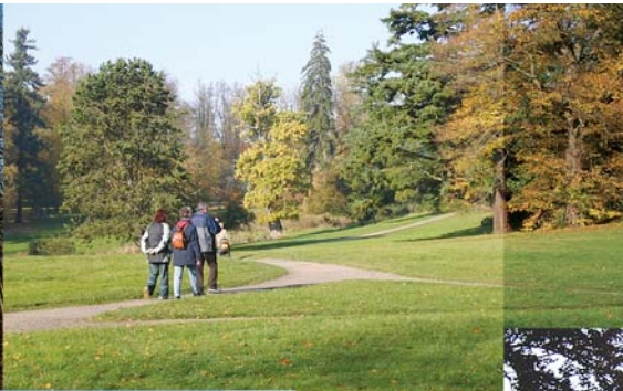
Schlosspark Putbus mit Orangerie