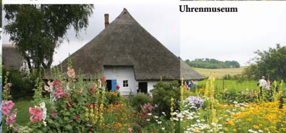
Pfarrwitwenhaus Groß Zicker